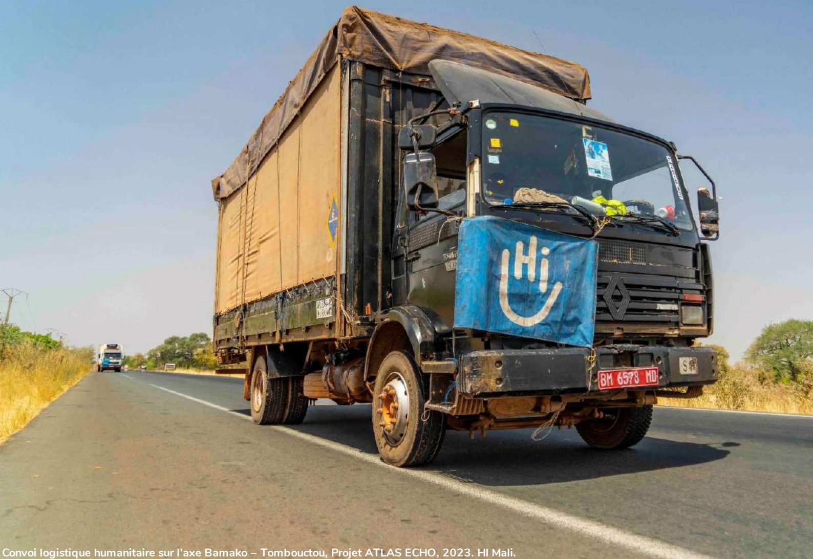
Convoi logistique humanitaire sur l'axe Bamako – Tombouctou, Projet ATLAS ECHO, 2023. HI Mali.